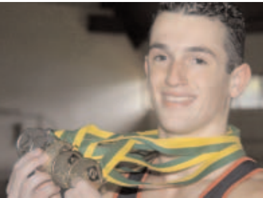
Campeão na Copa do Mundo, o ginasta Diego Hypólito é um dos atletas da base que o país revelou

Em fevereiro deste ano, o Comitê Olímpico Brasileiro apresentou a Demonstração da Aplicação dos Recursos Provenientes da Lei Agnelo/Piva referentes ao ano de 2003. Além da criação de equipes olímpicas permanentes e realização de treinamento continuado e específico no Brasil e no exterior, o investimento para a descoberta de novos talentos foi uma das ações realizadas com base nos recursos da Lei Agnelo/Piva. E os resultados não mentem: em apenas dois anos de uso, a Lei está causando uma revolução no esporte olímpico brasileiro.