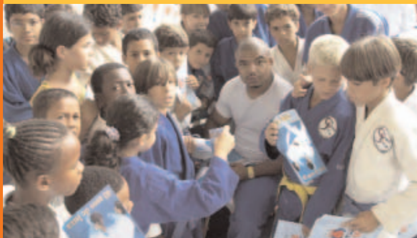
Medalha de prata em Sydney 2000, o judoca Carlos Honorato durante uma aula promovida pelo COB, no Rio

As vésperas dos Jogos Olímpicos de Atenas, o Comitê Olímpico Brasileiro e as Confederações Brasileiras Olímpicas já se preocupam com os dois próximos ciclos olímpicos, que compreenderão os Jogos Olímpicos de Pequim, em 2008, e os Jogos Olímpicos de 2012, cuja sede será definida pelo COI no