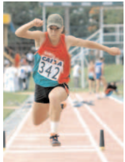
Atleta em ação nos Jogos da Juventude 2003