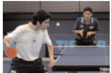
O tênis de mesa conta com jovens talentos

minton, beisebol, boxe, canoagem (slalom e velocidade), ciclismo (pista), esgrima, ginástica artística, ginástica rítmica, judô, levantamento de peso, natação, natação sincronizada, pólo aquático, remo, saltos ornamentais, taekwondo, tênis de mesa, tiro com arco, trampolim acrobático, triatlo e vela desenvolvem este tipo de trabalho. "Além de se criar uma infra-estrutura esportiva adequada para o aprimoramento do treinamento e promover a busca de resultados, o trabalho das Equipes Olímpicas Permanentes também tem a base como objetivo. Há uma integração entre as diferentes faixas etárias e isso é muito importante para o desenvolvimento do atleta", garante.